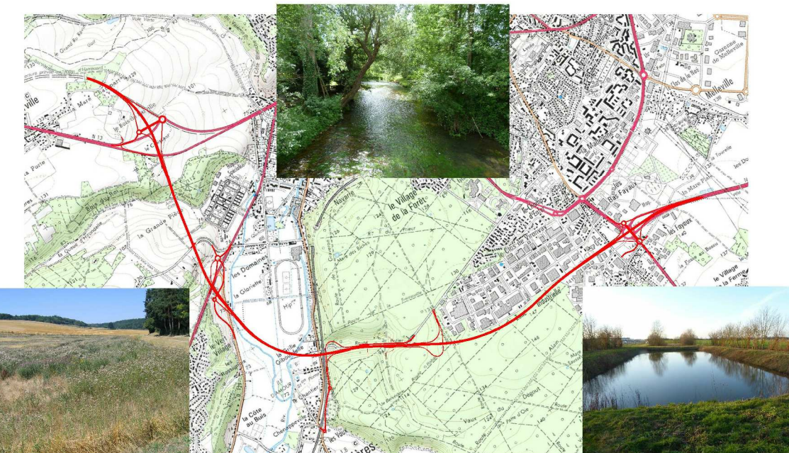
ANNEXE 4 : DÉFINITION DU PROJET 4.3. Repérage des impluviums et des bassins de traitement sur le profil en long - profil en long de la section courante